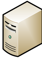
Windows Server / PC Videoserver

Mit einem JavaProgramm welches die LPR Daten von der Kamera abrufen. Die LPR Daten sind über einen http Port für 3. Applikationen vom Videoserver abrufbar.