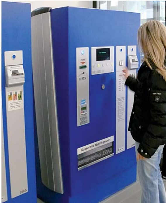
Vandalismus im Kassenbereich war, vor der Installation der Videoüberwachung, ein grosses Problem.

Plus der WV-NF302-Kameras. Die qualitativ erstklassigen Geräte gewährleisten auch bei schwierigen Lichtverhältnissen – wie sie in Parkhäusern vorherrschen – allzeit aussagekräftige Videobilder. Herzstück der Sicherheitsanlage ist die neu installierte IP-basierte Videoüberwachung. Comtronic Communications AG setzte zur Steuerung der Videoanlage und zur Dokumentation der Daten auf die Software XProtect von Milestone. Die aufgezeichneten Bilder werden über ein separates Netzwerk auf den Aufzeichnungsserver, einen HP Server Dual Core, übertragen und tagsüber zur Live-Überwachung auf dem Monitor dargestellt bzw. nachts zur Nachverfolgung aufgezeichnet. Mit einer Kapazität von 1,2 Terabyte steht jederzeit genügend Platz für das Speichern der grossen Datenmengen zur Verfügung. Für XProtect von Milestone sprachen die hohe Benutzerfreundlichkeit, die auch in Sicherheitsanlagen wenig geschulte Nutzer intuitiv die richtigen Schritte tun lässt, sowie die Zuverlässigkeit und Offenheit des Systems.